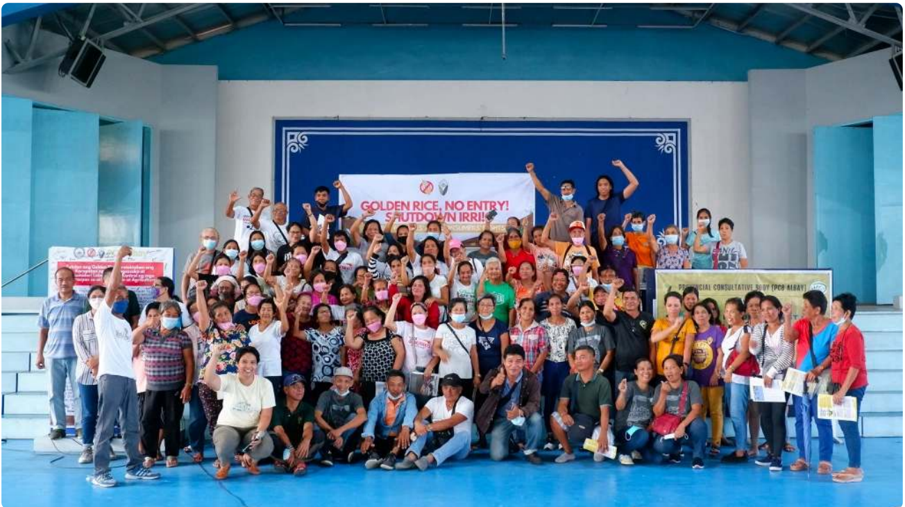
Stoppa Golden Rice! Nätverk (SGRN)