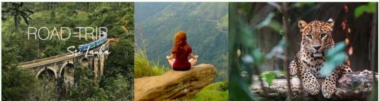
Semester i Sri Lanka - Guidade naturturer och expeditioner

Tajming: Experimentet lanserades under covid-19-pandemin, när Sri Lankas turismberoende ekonomi redan var hårt påverkad.